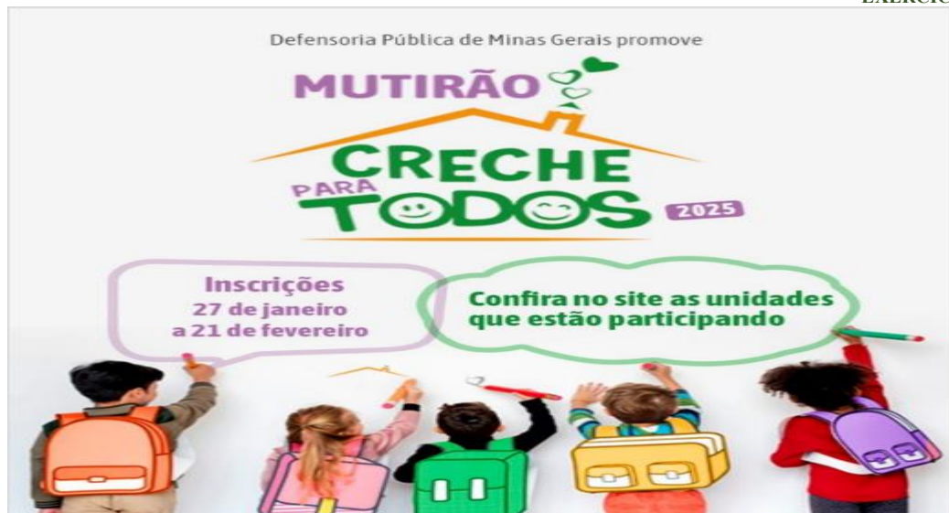
CooProC - Coordenadoria de Projetos, Convênios e Parcerias

O Projeto "Defensoria nas Escolas" - O projeto realiza atividades educativas em escolas, levando estudantes de 8 a 14 anos a palestras e dinâmicas sobre cidadania, respeito, convivência e acesso a direitos.