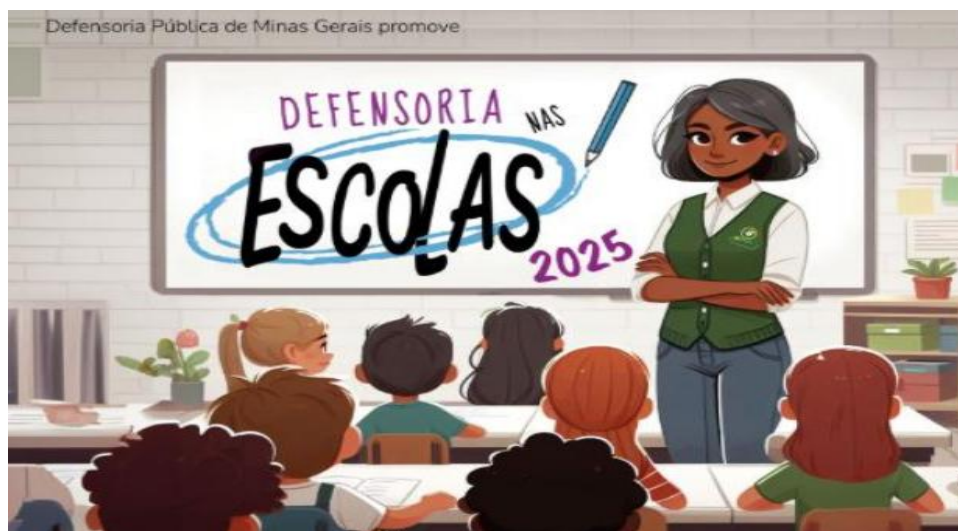
CooProC - Coordenadoria de Projetos, Convênios e Parcerias

O Projeto "Defensoria nas Escolas" - O projeto realiza atividades educativas em escolas, levando estudantes de 8 a 14 anos a palestras e dinâmicas sobre cidadania, respeito, convivência e acesso a direitos.