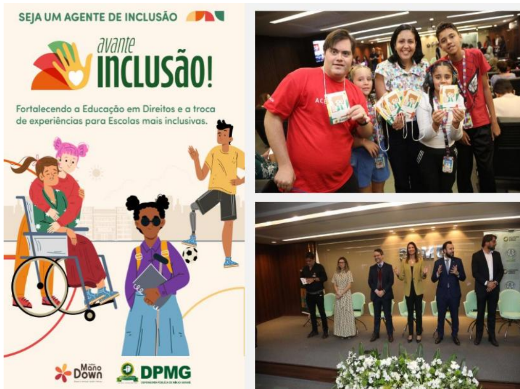
CooProC - Coordenadoria de Projetos, Convênios e Parcerias

ao preconceito e ao bullying, além de atividades de capacitação. A iniciativa também incentiva o diálogo com toda a comunidade escolar, para que a inclusão seja verdadeira, acolhedora e efetiva.