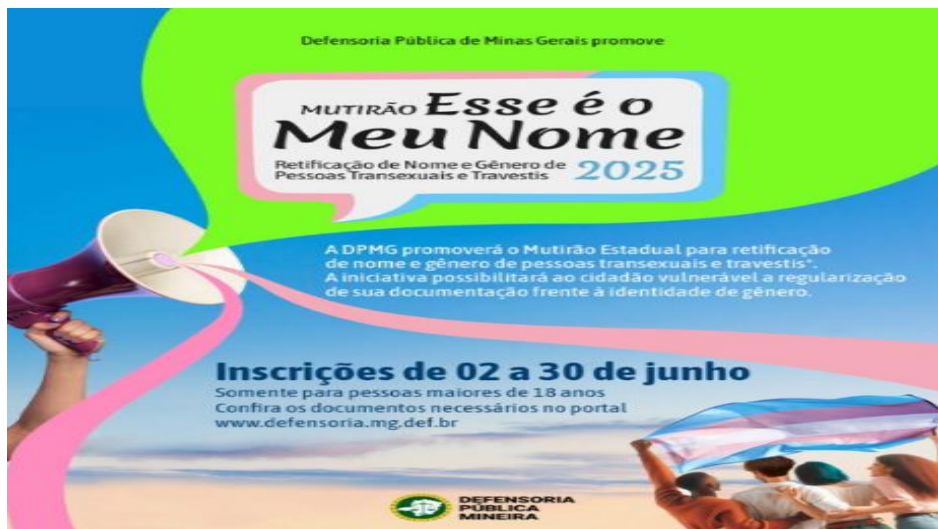
CooProC - Coordenadoria de Projetos, Convênios e Parcerias

O Projeto "Defensoria Vai até Você" - busca facilitar o acesso da população a direitos e soluções rápidas para conflitos familiares. Sua atuação foca na resolução extrajudicial, priorizando a conciliação em etapas integradas;