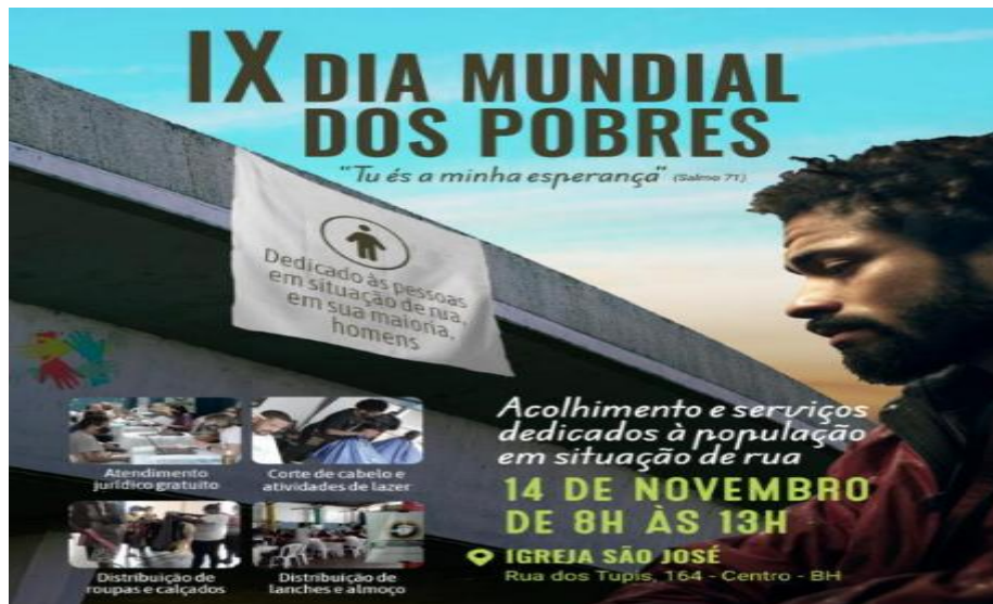
CooProC - Coordenadoria de Projetos, Convênios e Parcerias

Mutirão para Conversão de União Estável em Casamento – A iniciativa permite que casais em união estável formalizem gratuitamente sua relação, eliminando barreiras econômicas. A conversão em casamento reconhece todo o período de convivência, garantindo proteção jurídica e fortalecendo o vínculo afetivo. O projeto, realizado pela Defensoria Itinerante, atendeu 316 pessoas nos municípios de Araçuaí, Padre Paraíso, Itinga, Virgem da Lapa, Ponto dos Volantes, Belo Horizonte, Serro e Goiabeira;