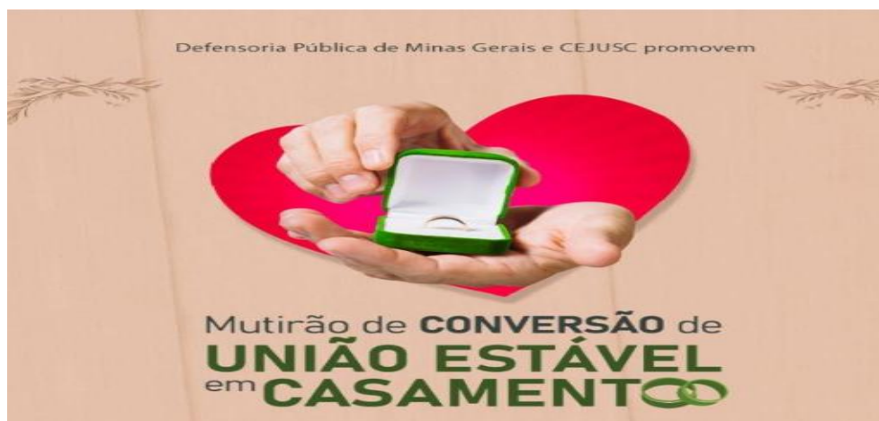
CooProC - Coordenadoria de Projetos, Convênios e Parcerias

Mutirão para Conversão de União Estável em Casamento – A iniciativa permite que casais em união estável formalizem gratuitamente sua relação, eliminando barreiras econômicas. A conversão em casamento reconhece todo o período de convivência, garantindo proteção jurídica e fortalecendo o vínculo afetivo. O projeto, realizado pela Defensoria Itinerante, atendeu 316 pessoas nos municípios de Araçuaí, Padre Paraíso, Itinga, Virgem da Lapa, Ponto dos Volantes, Belo Horizonte, Serro e Goiabeira;