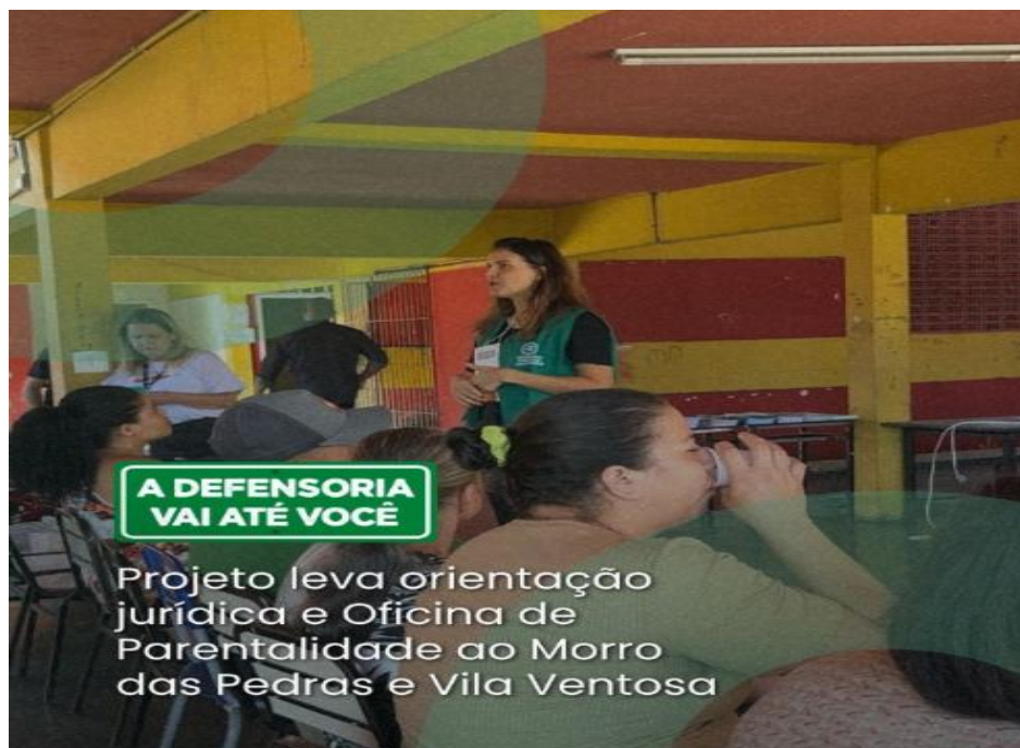
CooProC - Coordenadoria de Projetos, Convênios e Parcerias

O Projeto "Defensoria Vai até Você" - busca facilitar o acesso da população a direitos e soluções rápidas para conflitos familiares. Sua atuação foca na resolução extrajudicial, priorizando a conciliação em etapas integradas;